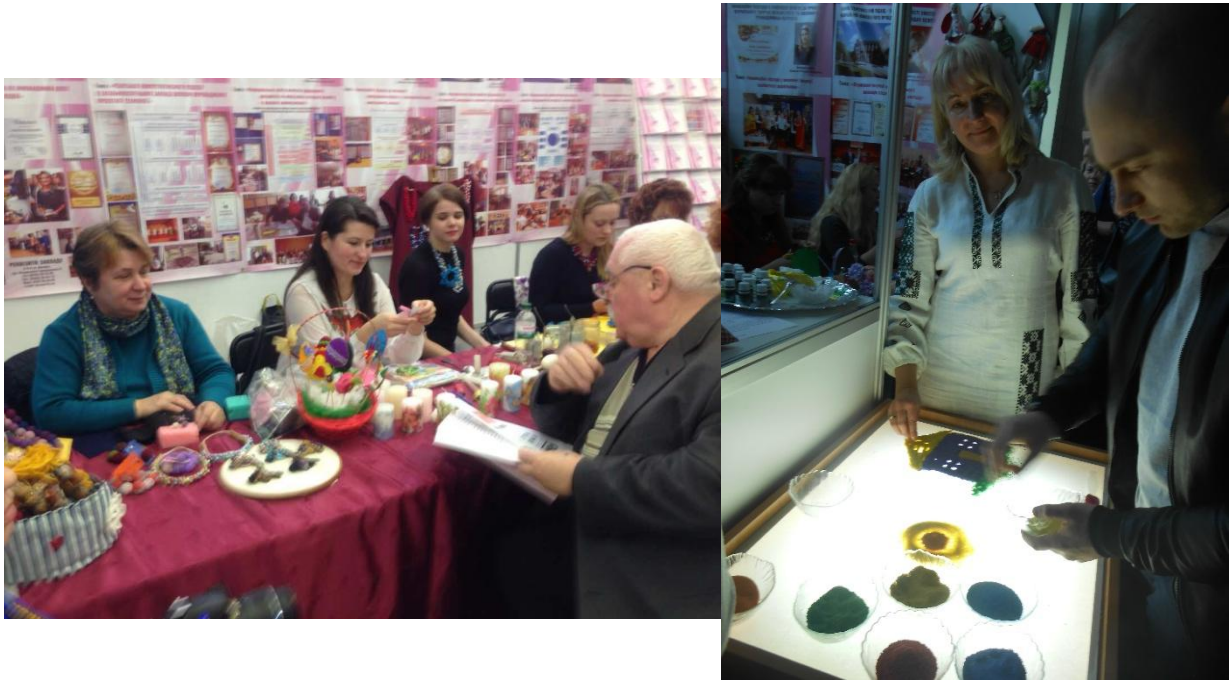
Фото 3. Майстер-класи 17 березня 2017 року

За рішенням оргкомітету Восьмої міжнародної виставки «Сучасні заклади освіти - 2017» навчальні заклади, що брали участь у конкурсі, отримали: