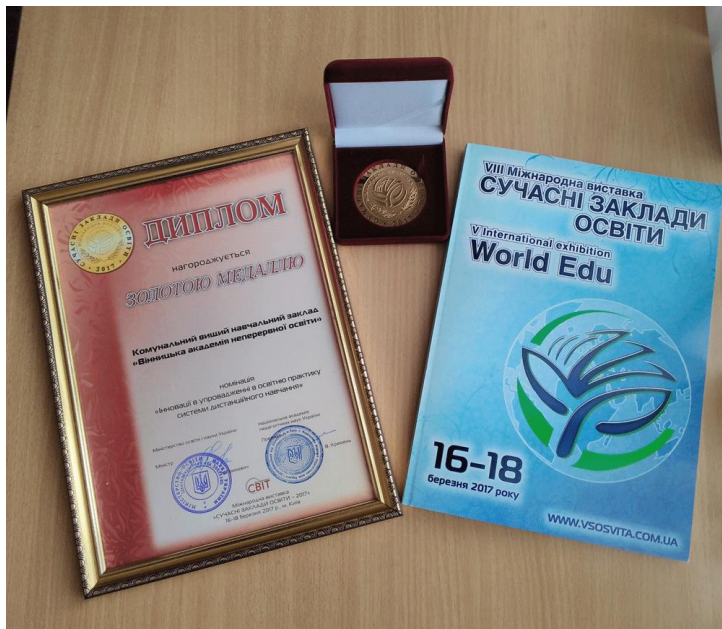
Фото1. Гран - прі «Лідер післядипломної освіти»; Золота медаль та диплом «За активну участь у створенні сучасної якісної системи національної освіти»

У рамках виставки Комунальний вищий навчальний заклад «Вінницька академія неперервної освіти» провів круглий стіл на тему «Неформальна та інформальна освіта як інноваційний ресурс розвитку фахової компетентності педагогічних працівників в системі неперервної освіти» , в якому прийняли участь і презентували свій досвід навчальні заклади, представлені на виставці. Всі учасники отримали іменні «Сертифікати доповідача круглого столу». У виступах вінничан педагогічному загалу представлені інноваційні технології та розробки, які створені і використовуються у закладах освіти Вінницької області (фото 1).